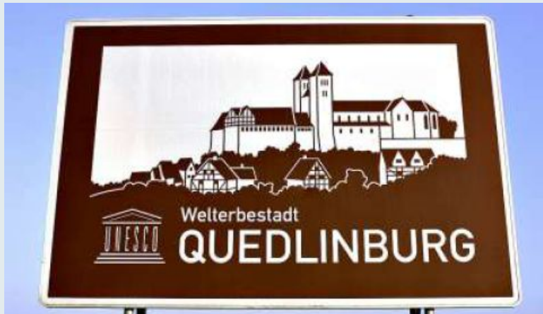
Schadet das Morgenrot-Projekt dem Welterbestatus? Das wird in Gutachten untersucht.

In dem Schreiben, das der Redaktion vorliegt, erklären die Monitoring-Beauftragten von Icomos