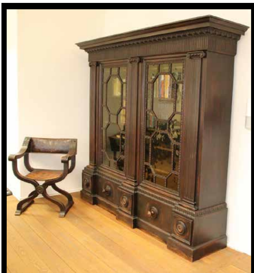
Bücherschrank und Scherenstuhl, 1920, Holz mit Glaseinsätzen, Maße: B 243 cm, H 213 cm, T 54 cm