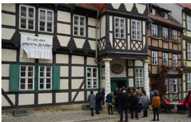
Gruppenvortrag vor dem Museum zur Einführung in die Ausstellung im Frühjahr 2019.

Das Literaturmuseum im Klopstockhaus wird in diesem Jahr nicht wie üblich am 31. Oktober in die Winterpause gehen. Die lange Schließung, die durch die Pandemie notwendig war, soll damit ausgeglichen werden. Das freut die Museumsmitarbeiter sehr, denn sonst wären durch die Baumaßnahmen im Schloss und den nicht beheizbaren Ständerbau in diesem Jahr gleich alle drei Städtischen Museen der Welterbestadt geschlossen. Mit der Winteröffnung kann den Touristen, die in die Stadt kommen, das wunderbare museale Angebot des Klopstockhauses zur Verfügung stehen – und wer etwas über die spannenden Baumaßnahmen im größten der Städtischen Museen, dem Schlossmuseum auf dem Stiftsberg, wissen möchte, ist hier auch an der richtigen Stelle.