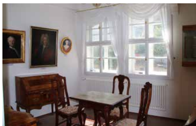
Im Obergeschoss gibt es eine Dauerausstellung zum Leben und Werk Klopstocks.