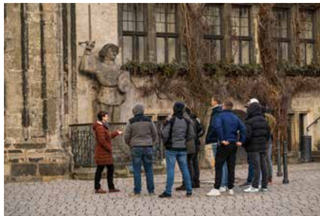
Während der Stadtführungen erhielten die Mitarbeiter und Bundeswehrsoldaten des Impfzentrums einen Einblick in das Welterbe und erfuhren viel Wissenswertes aus Geschichte und Gegenwart Quedlinburgs.