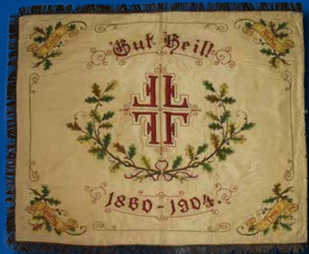
Traditionsfahne des GutsMuths-Männer-Turnvereins Quedlinburg, 120x146cm, Seide, 1904.

Die Städtischen Museen und das Archiv der Welterbestadt Quedlinburg präsentieren