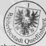
Oberbürgermeister Welterbestadt Quedlinburg